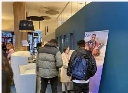
03.12.25 Découverte des métiers à la Cité des métiers Charles de Gaulle – Alliance