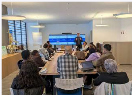
02.12.25 Présentation Aerowork CARPF

Ce que vous n'avez peut-être pas vu, mais qu'il fallait voir.